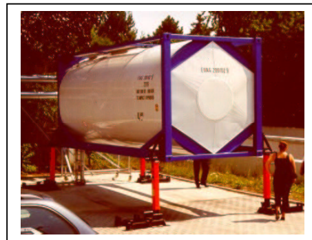
Foto: Beispiel für einen Container